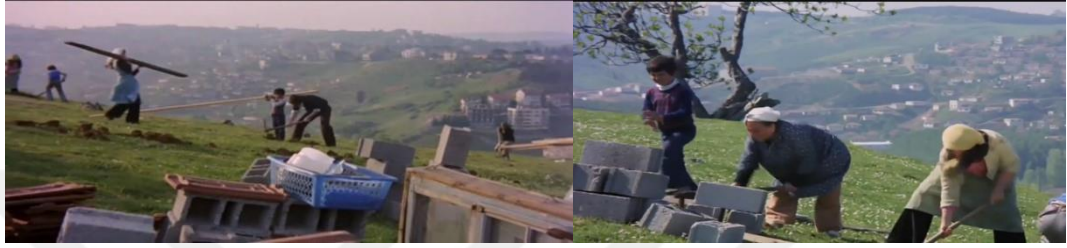
Şekil 4.44: Yeniden gecekodu inşası.

Turgut'un [2003] bahsettiği gibi gecekodu yapımı, kaynak sınırlamalarının kombinasyonu içinde örgütlenir. Tekeli'de [2010] gecekodunun olumlu yanlarından bahsederken gecekodunun, konutu için kaynak bulabilme sürecine uygun olmasından söz eder. Filmde de yönetmen sadece gecekodu yaşamı değil, onun üretim biçimine de dikkat çekerek gecekodunun göç ederken yanlarında getirdiği malzemelere kamerayı odaklar. Filmdeki "tuğladan ev" ifadesi de bir metafor olarak gecekodu halkının ulaşamadığı apartman dairesine bir atıftır.