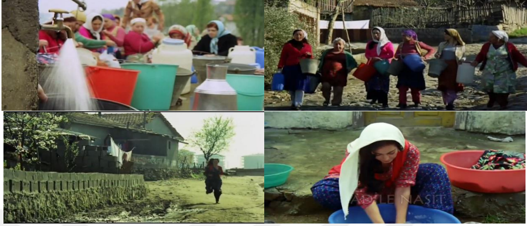
Şekil 4.32: Gecekonduların temel kamusal hizmetlerden yoksunluğu.

türlü sosyal verinin deęiş-tokuşuna sahne olan ve toplanma yeri haline gelen bir kentsel mekândır.