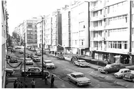
Şekil 4.52: Kentlilerin yaşadığı Nişantaşı.

memleketlerine geri gönderir. Kente göçün arttığı bir dönemde çekilen filmde aslında yönetmen kente göçü ve kentte onları bekleyen yaşamı yeniden kurgulayarak seyirciye sunmuş ve o dönem göç edecek olanlar için kent yaşamı hakkında bir algı yaratmıştır. Filmde göçmenlerin kentliler tarafından ötekileştirildiği ve bu ötekileştirilmenin hem sosyal yaşamlarına hem de mekânsal olarak yaşam alanlara yansıdığı görülür. Göçmenlerin ve kentlilerin kent içerisindeki ayrışma durumları, yaşadıkları semtlere, evlerine, giyim kuşamlarına ve eğlence mekânlarına kadar farklılaşmış olarak aktarılır (Şekil 4.56) (Şekil 4.57).