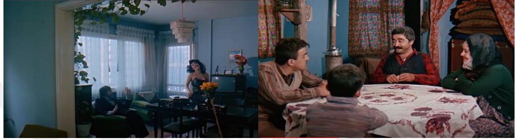
Şekil 4.15: Apartman dairesi (sol) ve gecekondu iç mekânı.

Göçün sonuçlarının daha derinden hissedildiği bir dönemde çekilen bu film kır-kent çatışmasını, kentleşmenin kırdaki ve kentteki insanın yaşantılarını etkileme biçimini, toplumsal yapıdaki ayrışmayı ve kültür farklılıklarını birey-mekân ilişkisinde kurgulayarak aktarmıştır.