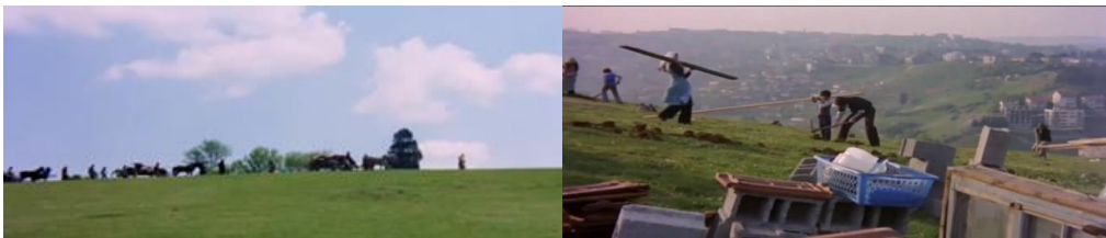
Şekil 4.26: Başka bir tepede yeniden gecekondular inşa etmeleri.