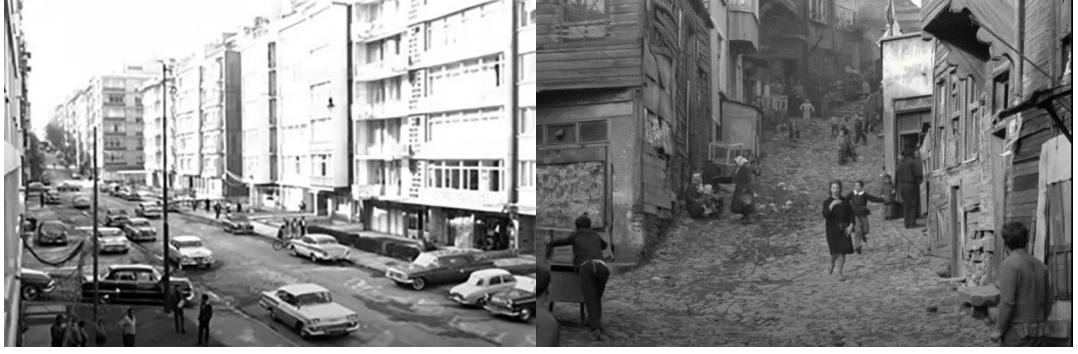
Şekil 4.56: Nişantaşı ve Fatih (Çarşamba mahallesi).