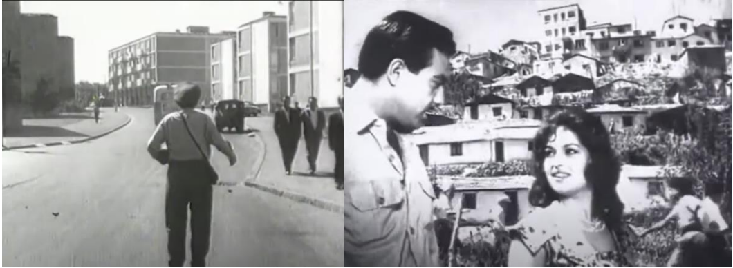
Şekil 4.19: Apartman blokları ve gecekondu mahallesi.

Filmde gecekondu, apartman ve villa biçiminde görülen konut tipolojileri toplumsal statüye göre farklılaşmaktadır (Şekil 4.21). Alt gelir grubunun yaşadığı gecekondu, kent merkezlerinde orta gelir grubu için apartmanlar ve üst gelir grubu için villalar resmedilir. Gecekondu her ne kadar toplumsal statüsünü yükseltmek ve apartmanda yaşamak istese de kentliler tarafından sömürüldüğü ve konut hakkını elde edemediği aktarılır. Buna ek olarak gecekondu halkı dayanışma ve birlik olma olgularıyla, kentliler ise bireyselliğin ön planda olduğu çıkar ilişkileriyle görülür.