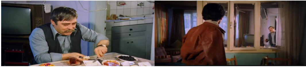
Şekil 4.42: Muhtar'ın evi.

Sadece muhtar karakteri, sosyal olarak kentlileşmese de ekonomik olarak kentlileşmeye çabalamaktadır. Diğer gecekondululardan gelir düzeyi ve yaşam alanı olarak daha üst konumdadır. Evi diğer gecekonducularla benzer özelliklere sahip olmakla beraber daha geniş ve apartman dairesi planlamasına mekânsal olarak daha yakındır. Divanların yerini koltuk takımları almış ve televizyon ekonomik durumun göstergesi olarak Muhtar'ın oturduğu masanın arkasında kadraja dahil edilmiştir (Şekil 4.46).