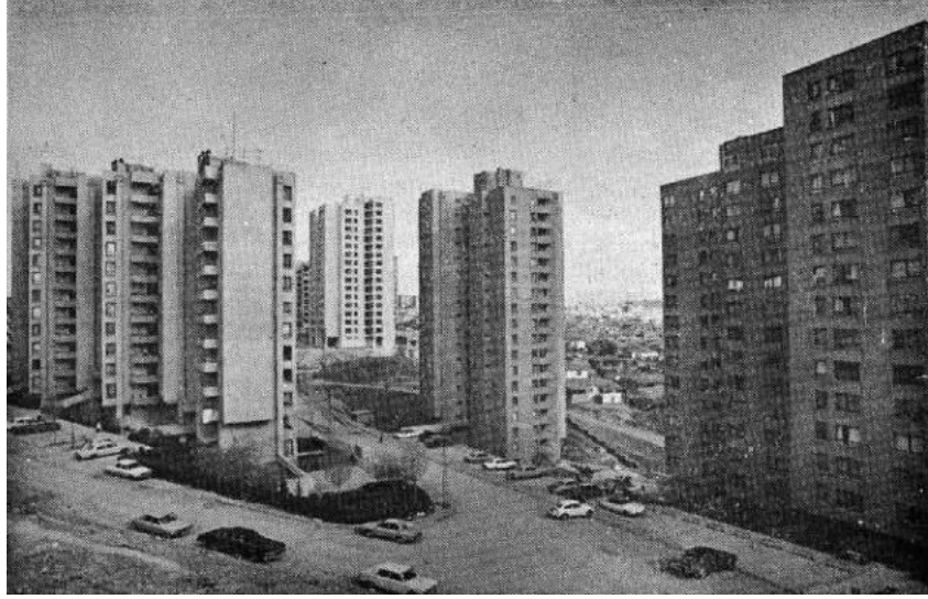
Şekil 3.2: MESA Ankara-Çankaya Sitesi.