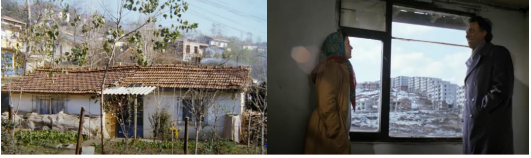
Şekil 4.22: Filmde yer verilen gecekondular.

Yusuf sürekli yıkım tehlikesiyle burun buruna olan gecekondular yerine farklı bir üretim yolu deneyerek ahşaptan yürüyen gecekondusunu üretir. Seyyar gecekonduyu yıkılma tehlikesiyle karşılaşmamak için kent içerisinde yürüterek farklı farklı yerlere konumlandırır (Şekil 4.27). Filmin sonuna doğru konumlandıkları yer ise villaların yanındır ancak bu villalarda gecekondular gibi kaçak yapılmıştır. 1980’li yıllara kadar barınma hakkı olarak görülen gecekonduların oluşumları sonrasında getirilen af ve yasalar kaçak yapılaşmanın da oluşumuna imkân sağlamıştır. Sadece gecekondular değil birçok üst sınıf insanlarda kaçak olarak konutlar inşa etmeye başlamıştır. Filmin sonunda Yusuf’un seyyar gecekondusunun bulunduğu alandaki villaların yıkımı gerçekleşmiş ve Yusuf bu yıkımdan etkilenmeyerek yürüyen gecekondusunu alıp başka bir yere gitmiştir. Film, kentleşme sonrası nüfus yoğunluğu ve ekonomik güçlüklerin insanların barınma hakkına erişememesini ve sürekli yıkılan gecekonduları trajikomik bir açıdan yorumlayarak seyirciye aktarmıştır.