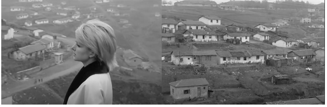
Şekil 4.54: Ayla ve gecekondu bölgeleri.

Deniz Kandiyoti'nin [1997] ifadesi ile, “toplumun geleneksel, kırsal ve az gelişmişten modern, şehirli, sanayileşmiş ve gelişmişe ya da alternatif olarak feodalden kapitaliste varsayılan amansız yürüyüşü bu arada ortaya çıkan karmaşık yapıları da ‘geçici’ (transitional) formlar olarak küçümsemeyi ya da göz ardı etmeyi” beraberinde getirmiştir. Gecekondu da başlangıçta masum barınma gereksinimleri ve geçici formlar olarak görülmüşse de sonrasında kalıcı hale gelerek kentsel doku ve kimliğin de güçlü unsurları olmuştur. Film içerisinde de gecekondu kentsel dokuya eklemlenmiş ve kent kimliğinin bir parçası haline gelmiştir. Semtler üzerinden aktarılan modernlik ve geleneksellik vurgusu gecekonduların kadraja girmesindeki mekânsal dizilim ile de vurgulanır. Filmde önce Türkiye’de savaş sonrası modernizmin tartışılmaz simgesi olan -yeni formu, yapısı ve malzemeleriyle teknik mükemmelliğin, hassasiyetin ve ilerlemenin sembolü haline gelen- İstanbul Hilton Oteli [Bozdoğan ve Akcan, 2012] görülür ve hemen ardından kamera açısını gecekondu bölgelerine çevirir. Burada gecekondu bölgesinin tam olarak nerede konumlandığı belli değildir ancak filmde verilen mekânsal bağlantı ile Hilton Oteli’nin çevresinde oluştuğuna dair bir algı yaratılır. Böylece kent merkezinde gelişen modernist görünüm ile çevresinde gelişen gelenekselliğe atfedilen gecekondulaşma, bilinçli olarak kentte var olan iki farklı ve birbirine zıt fiziksel oluşumları resmeder.