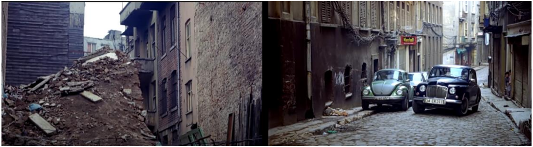
Şekil 4.16: Beyoğlu'nun kentsel dokusu.

Filmin mekanlarını, eskiye dair estetiğin çağcıl, arabesk, grotesk ve hoyrat bir pervasızlıkla tahrip edilmesine dair dramatik bir çerçeve sunar ve mekan tasarımları arasındaki çatışmanın güzel ve estetik olan eskinin tahrip edilip; kolaycı, kaba ve çıkar amaçlı olan kötünün üstün gelmesiyle kurgulanır [Akarsu, 2020]. Filmde Muhsin Bey'in evi ise eskiye bir atıf olarak seçilmiş 19. yüzyıl yapısı olan Doğan Apartmanı'dır. Apartman eski İstanbul'un en güzel semti olan Beyoğlu'ndadır. Beyoğlu'nun tahrip edilmesini, kentleşmenin etkisiyle yıkılan yapıları ve çehresinin günden güne değişimini filmde verilen sahnelerden görmek mümkündür (Şekil 4.18).