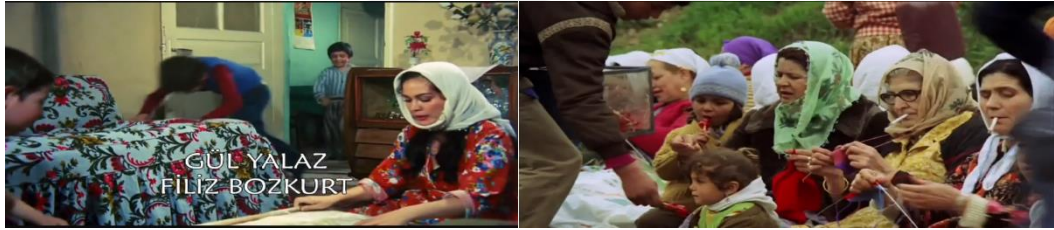
Şekil 4.36: Sultan'ın evi ve çeşme başındaki kadınlar.

Güngör'ün [1993], kentleşmeyle gelen kente ve köye özgü değerler ile yaşam tarzlarının karşı karşıya gelmesinden doğan karmaşıklık ve kozmopolit yapılanma olarak tanımladığı arabesk, arada olma hali ve hem köye hem kente dair taşıdığı izlerle mekân ve birey üzerinden sinemasal anlatıya dahil olur. Gecekonducularda yer alan divanlar, süs eşyası olan yapay çiçekler ile çiçek desenli avize, elbiselerde olduğu gibi diğer eşyalarda ve perdelerde görülen yaprak veya çiçek desenleri 18 , kadınların elbisenin altına pantolon giymesi, çeşme başında sıra bekleyen kadınların dolma sarması veya örgü örme arabesk kültürün karmaşıklık ve aradalık halini yansıtır (Şekil 4.40).