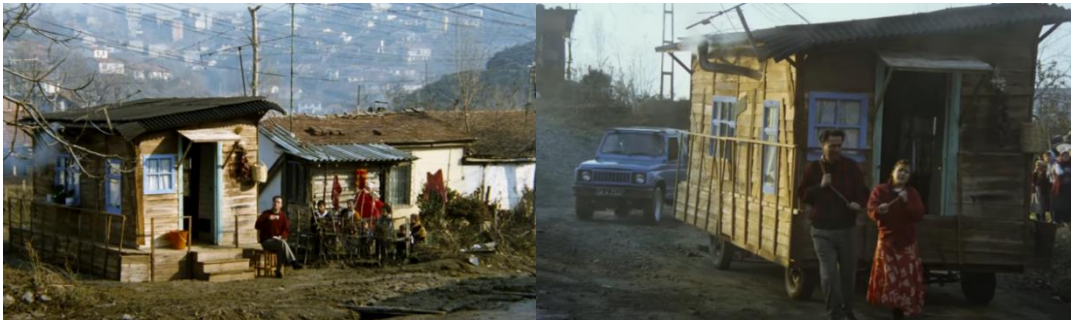
Şekil 4.23: Yusuf’un yürüyen gecekondusu.

Yusuf sürekli yıkım tehlikesiyle burun buruna olan gecekondular yerine farklı bir üretim yolu deneyerek ahşaptan yürüyen gecekondusunu üretir. Seyyar gecekonduyu yıkılma tehlikesiyle karşılaşmamak için kent içerisinde yürüterek farklı farklı yerlere konumlandırır (Şekil 4.27). Filmin sonuna doğru konumlandıkları yer ise villaların yanındır ancak bu villalarda gecekondular gibi kaçak yapılmıştır. 1980’li yıllara kadar barınma hakkı olarak görülen gecekonduların oluşumları sonrasında getirilen af ve yasalar kaçak yapılaşmanın da oluşumuna imkân sağlamıştır. Sadece gecekondular değil birçok üst sınıf insanlarda kaçak olarak konutlar inşa etmeye başlamıştır. Filmin sonunda Yusuf’un seyyar gecekondusunun bulunduğu alandaki villaların yıkımı gerçekleşmiş ve Yusuf bu yıkımdan etkilenmeyerek yürüyen gecekondusunu alıp başka bir yere gitmiştir. Film, kentleşme sonrası nüfus yoğunluğu ve ekonomik güçlüklerin insanların barınma hakkına erişememesini ve sürekli yıkılan gecekonduları trajikomik bir açıdan yorumlayarak seyirciye aktarmıştır.