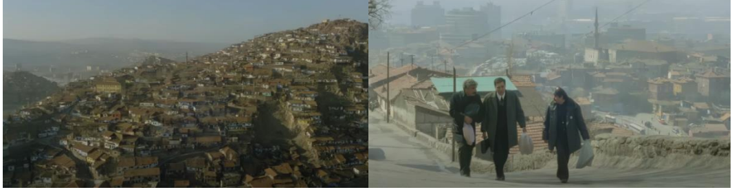
Şekil 4.20: Gecekondu mahallesi (Altındağ).

ilişkilidir (Şekil 4.24) (Şekil 4.25). Sokakları daha düzenli ve altyapı problemleri yoktur. Gecekondualarda yaşayan halkın göçmen olup olmadıkları dair belli bir öge yoktur. Mahallede toplumun alt tabakasını oluşturan insanlar yer almaktadır.