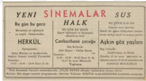
Şekil 2.2: 2 Mayıs 1939 Ulus Gazetesi.

Tüm bu süreç içerisinde arabesk müziğinin oluşmasını etkileyen tek sebep Arap müziğine ve filmlerine yönelmek değildir ancak etkisinin büyük olduğunu söylemek mümkündür. 1948 yılında Türkiye’ye film ithâlinin ve Arapça olan Mısır film müziklerinin çalınmasının yasaklanması [Stokes, 1998], halkın belirli bir kesiminin geleneksel olandan kopamaması ve yaşam biçimlerini ifade edecek bir müzik türünün arayışı içinde olması; yeni bir tür olan arabeskin oluşumunu tetiklemiştir. Bu müzik türünün gelenekselden yana benimsediği tavır ve doğulu olma hali; onu aynı dönemde Batı’ya yönelmiş ve çağdaşlaşmayı simgeleyen Türk tarzı batı müziğinin karşısına yerleştirmiştir. Arabesk, müzik türü olarak adlandırılmanın ötesinde her türlü olumsuz kavramı, yozlaşmayı çağrıştıran bir terim haline gelmiştir.