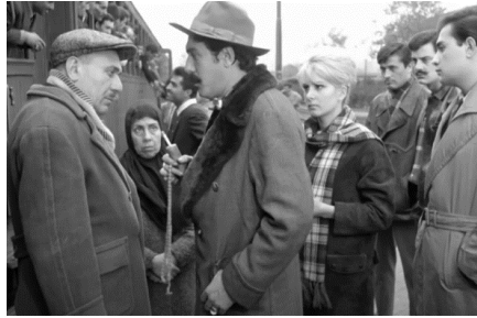
Şekil 4.50: Haybeci ve memleketlerine dönen Maraşlı aile.

Filmde kentte tutunabilen yalnızca iki karakter vardır: Haybeci ve ailenin küçük oğlu Kemal. Yönetmen bireyselliği öne çıkararak; kent insanının yalnız olmasını, aile olmanın verdiği sorumlulukların çokluğuyla kentte başarısız olunmasını ve en önemlisi ya Kemal gibi eğitim yoluyla kültürel açıdan kentlileşerek ya da Haybeci gibi ekonomik açıdan kentlileşerek kente tutunmanın mümkün olabileceğini vurgular.