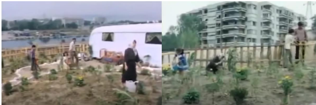
Şekil 4.22: Hurdanın önündeki bahçeleri.

Film ilerledikçe araba hurdası bir yuvaya dönüşerek geleneksel köy yaşantısının izleri buraya taşınmıştır. Etrafını çitle çevirdikleri araba hurdasının ön kısmını bahçe yaparak küçük bir tarla kurmuşlardır. Köy ve gecekondular yaşantısında olduğu gibi ev içi işler dışarıya taşınmıştır. Gündelik işler ve eylemler araba hurdasının etrafında kurdukları bahçede yapılmaktadır (Şekil 4.22).