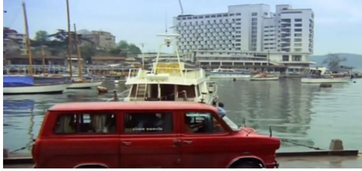
Şekil 4.41: Filmde gösterilen Tarabya Oteli.

Sadece muhtar karakteri, sosyal olarak kentlileşmese de ekonomik olarak kentlileşmeye çabalamaktadır. Diğer gecekondululardan gelir düzeyi ve yaşam alanı olarak daha üst konumdadır. Evi diğer gecekonducularla benzer özelliklere sahip olmakla beraber daha geniş ve apartman dairesi planlamasına mekânsal olarak daha yakındır. Divanların yerini koltuk takımları almış ve televizyon ekonomik durumun göstergesi olarak Muhtar'ın oturduğu masanın arkasında kadraja dahil edilmiştir (Şekil 4.46).