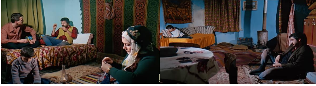
Şekil 4.14: Göç eden ailenin köydeki evi (sol) ve kentteki gecekondusu.