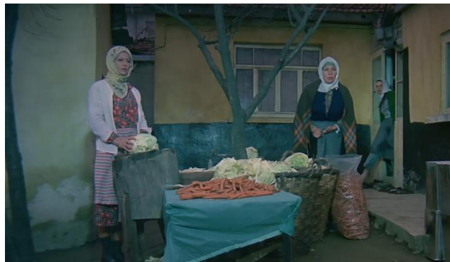
Şekil 4.10: Ev içi yaşamın dışarı taşması.