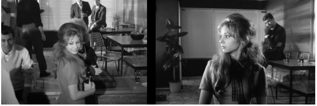
Şekil 4.63: Nişantaşı'ndaki apartman dairesi.