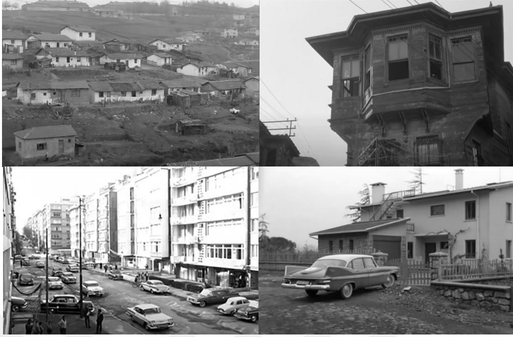
Şekil 4.66: Kent içerisinde farklılaşan konut üretim biçimleri.

Kadın figürü üzerinden aktarılan geleneksellik ve modernlik vurgusu filmin sonuna doğru kadının özgürlüğündeki ayırım üzerinden daha da netleşir. Göç eden ailenin kızı Fatma yaşam alanının ev ile sınırlandırılması ve kent yaşamında içine düştüğü karmaşa sonucu evden kaçarak intihar etmiştir. Kentin sosyalleşme mekânlarında sıkça gösterilen Ayla ise Kemal ile ailesini tanıştırmış ve nişanlanmıştır. Film sonunda Maraşlı aile memlekete dönerken Kemal Ayla ile İstanbul'da kalmış ve mutlu bir tablo çizilmiştir. Fatma'nın intihar sahnesinde ise arka planda vurgulanan İstanbul; kentleşme sonrası meydana gelen düzensiz kent dokusuyla ve çok katmanlılığıyla kadraja dahil edilir. Birey ve mekân ilişkisinin vurgusu yapılan sahnede, Fatma'nın içinde bulunduğu karmaşıklık ve çıkmaz durum kent dokusuyla örtüşür (Şekil 4.71).