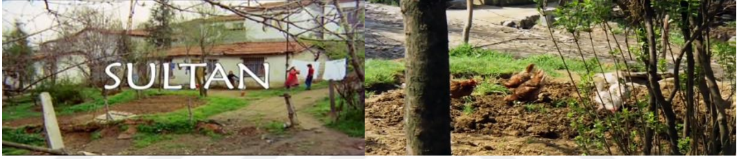
Şekil 4.27: Köye ait unsurların gecekonduya devam etmesi.

Kongar, gecekondu bölgelerini bir tampon kurum veya tampon mekanizma 17 olarak ele alır. Bu tampon mekanizmayı içinde yaşadığı insanı; yabancı kent yaşamından koruyarak yaşama imkânı sağlayan, kentin öteki bölge ve ekonomik kesimleri ile etkileşimi ve bu etkileşim yoluyla bütünleşmeyi de sağlayan aynı zamanda köy ile de bağları bütünüyle koparmayan bir yapı olarak tanımlar [Kongar, 1982]. Sultan filminde de gecekondu, kentin öteki bölge ve ekonomik kesimleri ile etkileşimi sağlarken kıra ait yaşam tarzını da devam ettirdikleri ancak kendi içine dönük, yalıtılmışlığını yeniden üreten bir olgu olarak karşımıza çıkar (Şekil 4.31). Gecekondulular, kentin kültürel ve sosyal alanlarından uzak biçimde sadece gerekli ihtiyaçlar doğrultusunda kent merkezini kullanmaktadır (Şekil 4.32).