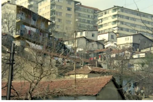
Şekil 4.17: Gecekondu mahallesi ve apartman blokları.

Film içerisinde gecekonduların bulunduğu tepelerin arkasında kent merkezinde var olan apartman blokları görünür (Şekil 4.19). Kent içerisindeki mekânsal farklılıklar konut tipolojisi ile vurgulanırken sınıfsal farklılıklar karakterler üzerinden vurgulanır. Toplumsal statüdeki farklılıklar doğrultusunda kentteki imkânlardan faydalanılabilir. Gecekondu halkta gidecek başka bir yeri olmadığı için yıkıma dirense bile tapusuz arazilerde bulunmalarından dolayı yıkıma engel olamazlar. Filmin sonunda yıkıma karşı direnen gecekondu halkının birlik olma, dayanışma ve mücadele etme gibi eylemlerine odaklanırken aynı zamanda kent içerisindeki sınıfsal ve ekonomik farklılıkla, ötekileştirilme ve çaresizlik de resmedilmiştir.