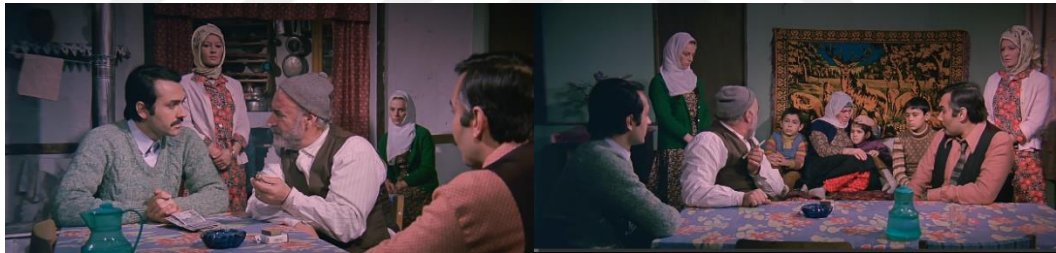
Şekil 4.9: Gecekondulu ev içi mekânı.

Yaşam biçimlerine ve ev içi mekân örgütlenmesine bakıldığında taşradaki düzenin aynısı devam etmektedir. Kadınlar ev içi yaşamlarını gecekondunun bahçesine taşıyarak gündelik işlerini burada yapmaktadır. Kadının yaşantısı ev yaşamıyla sınırlıdır ve giyim kuşamları taşradakiyle aynıdır (Şekil 4.9) (Şekil 4.10).