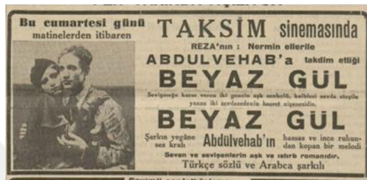
Şekil 2.1: 9 Kasım 1939 Cumhuriyet Gazetesi.

“Nitekim kendi beğeni düzeylerine uygun olan müziği radyolarda dinleyemeyen halk kendisine batıdakinden daha yakın olan Arap müziğini dinlemek üzere antenlerini Arap radyolarına çevirmişti...günde beş vakit duydukları ezan sesi sayesinde Arap müziğinde oldukça önemli bir yeri olan Hicaz makamıyla da haşır neşir sayılırlardı. Bu etkenlere bir de radyodan dinlemeye başladıkları Arap müziğinin eklenmesi Türk insanın o yönde bir kulak dolgunluğunun, bir beğeni düzeyinin oluşmasını kaçınılmaz kılmaktaydı” [Güngör, 1993].