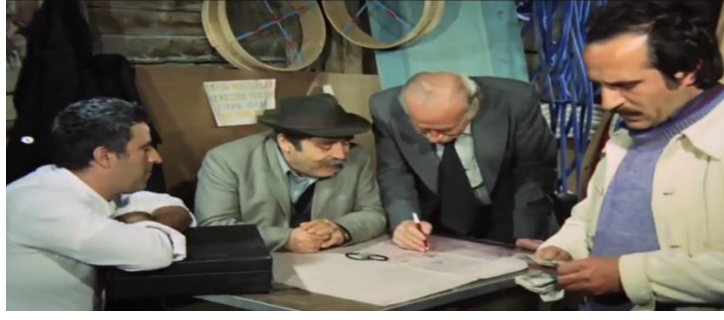
Şekil 4.34: Arsa rantiyecileri, muhtar ve gecekondulu.

Filmde gecekonduların mülkiyetindeki değişime bakıldığında, ilk etapta Muhtar'ın denetiminde olan tapusuz gecekonduların göç edenlere satılarak gecekonduların kendi evini üretme süreci başlar. Sonrasında ise çevre yolunun yapımından dolayı arsa rantiyecilerinin arsaları satın alması ve gecekonduların tahliye edilme süreci ile devam eder (Şekil 4.38). Filmde gecekonduların mülkiyetindeki bu değişim; kentteki ulaşım akslarının değişmesinden ve İstanbul'un iki yakasının karayolları sistemiyle bağlanmasından doğan ulaşım kolaylığı ile eskiden tümüyle gecekonduların nüfusunun alanı olan kent çeperlerinden artık farklı gelir gruplarının da pay istemeye başlaması ve Şenyapılı'nın [1998] belirttiği gibi kent çeperi üzerinde "hak paylaşımı savaşının" başlaması şeklinde yorumlanabilir.