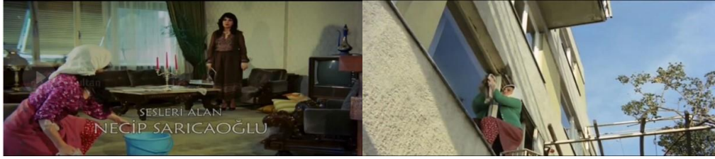
Şekil 4.24: Sultan'ın apartmanlara çalışmak için gitmesi.

Göç ile gelen kültürel ikilikler filmde daha çok kadın figürü üzerinden beden-mekân ilişkisiyle verilir. Gecekondu kadını ile kentli kadın bu karşıtlığın özneliği olarak karşımıza çıkar. Gecekonduya yaşayan Sultan'ın kent merkezindeki bir eve temizliğe gittiği sahnede arka fonda giyim ve yaşam tarzıyla onun tam zıttı olan kentli kadın görülür (Şekil 4.28). Kentli kadın figürü dönemin mimari anlayışını yansıtan mobilyalarla döşenmiş zengin bir apartman katının salonu ile özleşmiş olarak görülürken, Sultan kıra özgü giyim tarzıyla alt sınıf olarak ön planda aktarılır.