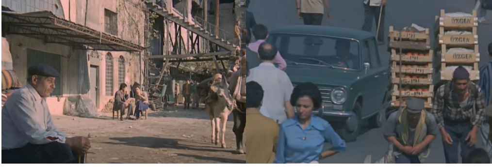
Şekil 4.11: Şanlıurfa (sol) ve İstanbul.

Filmde kardeşler birbirlerine bağlı olmasa da kentin onlar üzerinde yarattığı ekonomik sıkıntılar nedeniyle arzu edilene ulaşma uğruna birbirlerinden nasıl vazgeçtiklerini beyaz perdeye taşımıştır. Göç eden altı kardeşin ne sermayeleri vardır ne de bir meslekleri vardır. Kardeşler kentte seyyar satıcılık yaparak ya da fabrikada çalışarak kente tutunmaya çabalamaktadır ancak bu da yeterli olmayacak ve kız kardeşler evlendirilerek başlık parasıyla ekonomik durumlarını düzeltmeye çalışacaklardır. Kente tutunmak için her yolu deneyen altı kardeş yine de kentteki yaşama ayak uyduramayarak parçalanmıştır. Yönetmen, kentli yaşam biçiminin taşradan göç edenler için uygun olmadığını ve ne yaparlarsa yapsın kente tutunmanın imkânsızlığını ele almıştır.