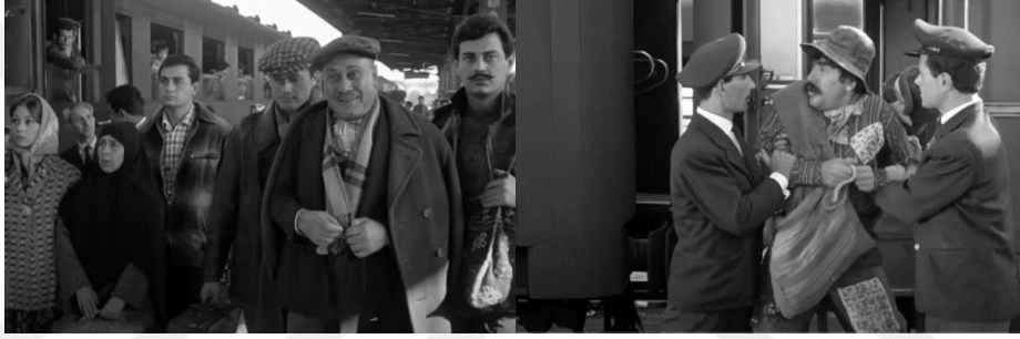
Şekil 4.49: Haybeci ve Maraşlı ailenin trenden inışı.

Gurbet Kuşları'nda kente göç serüveni filmin başlangıcında, Maraşlı ailenin Haydarpaşa Garı'na varması ile başlar. Trenden inilen sahnede, filmin anlatısına sonradan hâkim olacak iki göç kurgusu verilir. İlki ailenin İstanbul'a göçü, ikincisi ise trenden tek başına göç eden Haybeci karakteridir (Şekil 4.53). Film boyunca kente göç serüveni bir ailenin ve tek başına kente gelen bireyin üzerinden yansıtılır. Maraşlı aile kente bir miktar birikim ile gelmişken Haybeci trene bile kaçak olarak binmiştir. Filmin sonunda ise Maraşlı aile -ailenin küçük oğlu Kemal hariç- yine Haydarpaşa Garı'ndan memleketlerine geri dönerken Haybeci ise kendi gecekondu mahallesine gelecek olan hemşerileri için Kayseri'ye gitmektedir (Şekil 4.54).