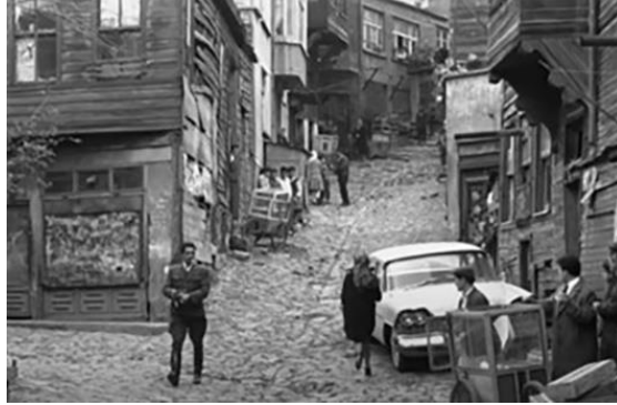
Şekil 4.1: Çarşamba mahallesi.

Filmde gösterilen semtlerde ise mekânların doku ve düzenlenme biçiminde ve bireylerin kültürel yapısında olan farklılığa vurgu yaparak modernlik-geleneksellik, geçicilik-kalıcılık gibi karşıtlıkları algılatır. Örneğin; göç eden ailenin yaşadığı Çarşamba mahallesi ve filmde yer yer gösterilen gecekondu mahallesi düzensiz sokakları ve eskimiş evleriyle, üst gelirli insanların yaşadığı Nişantaşı ve Cihangir ise betonarme apartmanlar, asfalt yollu planlı çevreler ve daha düzenli bir kent dokusuyla aktarılır. Yönetmen burada bireyin yaşadığı yer ile toplumsal tabakalaşmadaki yeri arasında ilişki kurar (Şekil 4.1) (Şekil 4.2).