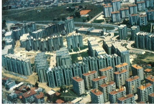
řekil 3.6: Soyak Gztepe Projesi.

Toplu Konut Yasası ve yeni kredi olanakları ile kooperatifler ve özel konut giriřimcileri tarafından byk ölekli uygulamalar yapılmaya bařlanmıřtır. 10.000 konutluk Bykřehir Kooperatifinin “Beylikdz Uydukent Projesi, Soyak Gztepe Projesi” bu trn rnekleridir (řekil 3.6) [Eryıldız, 1995]. Ayrıca Emlak Bankası'nın “Baheřehir, Atakent, Mimaroba ve Sinanoba projeleri” de bu dneme rnek verilebilir [Sey, 1994] (řekil 3.7) [Eryıldız, 1995].