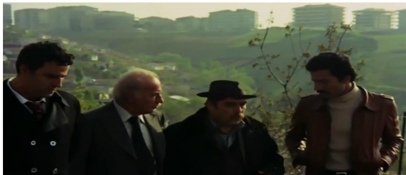
Şekil 4.48: Gecekondular (solda) ve apartman blokları.

Yine gecekondudan çıkarak kente gelinen bir sahnede dolmuşun yolcu indirmek için durduğu an, arka planda kadrāja modernist görünümüyle Tarabya Oteli'nin girmesi, filmde merkeze doğru gidildikçe değişen dokuyu ve merkezde modernliğin hâkim olduğunu vurgulama çabasıdır. Başka bir sahnede kamera açısının tepelere döndüğü anda gecekondular mahallelerini gösterip hemen ardından diğer yandaki apartman bloklarının görünmesi, kentteki gelenekçi-feodal kesim ile çağdaş-kapitalist kesim ayrımının sinemaya yansımalarıdır (Şekil 4.52). Dolmuş ise içerisinde hem gecekonduluyu hem de arabesk müziği kente ulaştıran bir ara mekândır. Filmde dolmuşu kullananlar sadece gecekondululardır ve arabesk müzik dolmuş aracılığıyla filmde var olur.