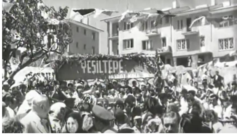
Şekil 4.18: Gecekondulunun satın aldığı kooperatifler.

Filmde gecekondu, apartman ve villa biçiminde görülen konut tipolojileri toplumsal statüye göre farklılaşmaktadır (Şekil 4.21). Alt gelir grubunun yaşadığı gecekondu, kent merkezlerinde orta gelir grubu için apartmanlar ve üst gelir grubu için villalar resmedilir. Gecekondu her ne kadar toplumsal statüsünü yükseltmek ve apartmanda yaşamak istese de kentliler tarafından sömürüldüğü ve konut hakkını elde edemediği aktarılır. Buna ek olarak gecekondu halkı dayanışma ve birlik olma olgularıyla, kentliler ise bireyselliğin ön planda olduğu çıkar ilişkileriyle görülür.