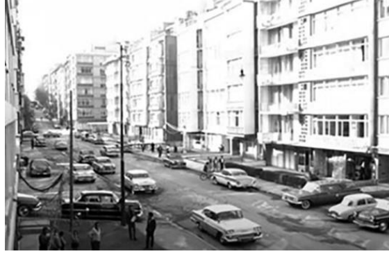
Şekil 4.2: Apartman hayatı-Nişantaşı.

Filmin sonunda ise İstanbul'a göç eden ailenin kızı Fatma'nın intihar sahnesinde arka planda tepeden bir bakış ile verilen İstanbul; çarpık kentleşmeyi, çok katmanlılığı ve yığılmayı vurgular (Şekil 4.3). Kimlik ve mekân ilişkisinin vurgusu yapılan sahnede, Fatma'nın içinde bulunduğu karmaşıklık ve çıkmaz durum kent dokusuyla örtüşür. Film, atıp fakültesi okuyup doktor olmak isteyen Kemal hariç ailenin memleketlerine dönmesiyle sonlanır. Ailenin tek başarılı bireyi olarak kente uyum sağlayan Kemal, kültürel ve sosyal açıdan kentlileşerek kente tutunmuştur.