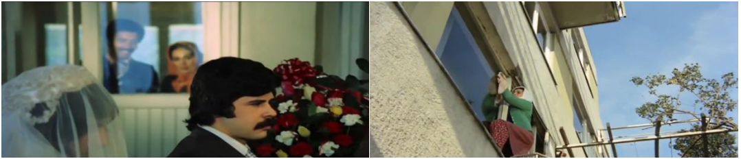
Şekil 4.28: Kente sadece kamu hizmeti ve iş nedeniyle gelmeleri.

Gecekondu halkının farklı şehir ve kültürden gelerek bir arada bulunma hali, filmdeki anlatıya da hakimdir. Karakterler farklı farklı yerlerden göç etmiştir ancak kentteki tek sosyal güvenceleri olan gecekonducularda bir arada yaşamak zorundadır. Tekdüze olarak verilen gecekondu halkında farklı olan tek karakter mahallenin muhtarıdır. Sarıyer ilçesindeki gecekonducularda geçen filmde, muhtar karakteri