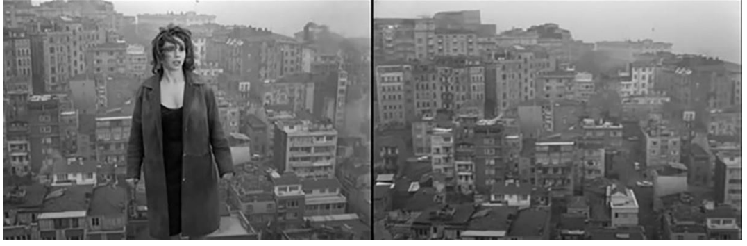
Şekil 4.67: Fatma'nın intihar sahnesi ve İstanbul.

Filmin tamamında kurgulanan mekânsal dizilime ve mekânlar arasındaki bağlantının kurulma biçimine bakıldığında özelde göç eden bir ailenin kent yaşamında karşısına çıkan zorluklar verilirken genelde kentleşme sonrası İstanbul'un farklılaşan semtleri aracılığıyla vurgulanan modernlik-geleneksellik algısı hâkimdir. Yönetmen; konutların tipolojisi, bulunduğu konumu, çevresi, insan tiplerini aracılığı ile taşralı-kentli zıtlığını, kentte meydana gelen mekânsal ve toplumsal değişimi ve kentleşemeyenlerin kentte tutunamayacaklarını perdeye aktarmıştır.