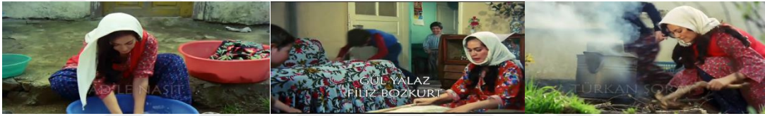
Şekil 4.45: Filmin girişinde verilen gecekondulu kadın imajı.

Sultan filmine bakıldığında mekân kurgusu gecekonduluların gündelik yaşamını yansıtmak biçimde kurgulanırken bir yandan da bazı metaforlar ve karşıtlıklar ile dönemin kente dair sosyal ve mekânsal problemleri ele alınır. Filmin ilk sahnesinde yönetmen jenerik bitene kadar Sultan'ın günlük yaşamından farklı zamanlara ve mekânlara ait kesitleri, arka fonda Sultan'ın hayatı kadar hareketli bir müzik eşliğinde hızlıca seyirciye sunar. Bu art arda verilen sahnelere bakıldığında gecekondulu kadın figürü hep bir koşturmaca içerisinde ve kendine ayıracak boş bir vakti yoktur (Şekil 4.49). Gecekondulu kadın bu şekilde resmedilirken Sultan'ın evine gittiği apartman dairesindeki kentli kadın kendine vakit ayırabilen daha sakin bir hayat içerisinde aktarılır.