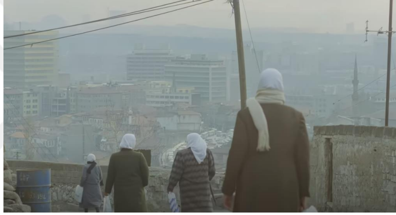
Şekil 4.21: Gecekonduaların kent merkezine yakın konumlanmaları.

1983-1988 arasında çıkarılan af yasaları ile gecekonducular yasaların izin verdiği büyüklükteki arsalarla dört kata kadar olan konutlar yapabilmeye hakkına sahip olmuştur. 1988 yılında çekilen filmde de Mehmet oturduğu gecekonduya kira ödemektedir ve ev sahibi burayı yıktırarak yerine apartman yaptırmak için gecekonduculuğunu müteahhitte vermiştir. Gecekonducular artık göçün ilk döneminde olan barınma gereksinimlerini gidermek için göçmenlerin yaptığı evlerden sıyrılmış ve gelir getiren, ticarileşen bir ögeye dönüşmüştür. Başka bir gecekonduya taşınması gereken ailede Mehmet düzenli bir işte çalışmasına rağmen gecekonduculuğunun kirasına bile gücü yetmemektedir.