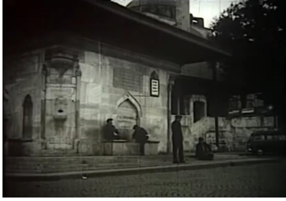
Şekil 4.4: Üsküdar III. Ahmed Çeşmesi ve Mihrimah Sultan Cami.

Filmde verilen gecekondü mahallesi dönemin yüksek apartmanlarının hemen dibindedir. Nesrin'in oturduğu gecekondunun penceresinden apartmanlar görünür ve pencere burada iki yaşam arasında sınır görevindedir. Nesrin apartmanlara özenerek orada yaşayanların hiç dertlerinin olmadığını ve hep mutlu olduklarını söyler (Şekil 4.5).