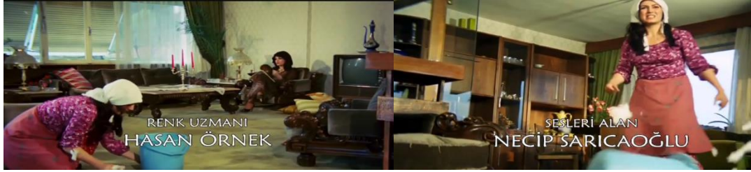
Şekil 4.43: Sultan'ın temizliğe gittiği apartman dairesi.

büyük boyutlarıyla dikkat çeken duvar boyunca bütünleşmiş bir vitrin, kalın ve ağır kumaş perdeler ile mekânsal atmosferin gecekondudan farklılaştığı görülür. Apartman dairesinde resmedilen mekânsal kurgu ile burada yaşayan kadının ayrıcalıklı konumuna atıf yapılır ve teknolojik bir öge olan televizyonunda mekândaki varlığı bu ayrıcalıklı hali pekiştirir.