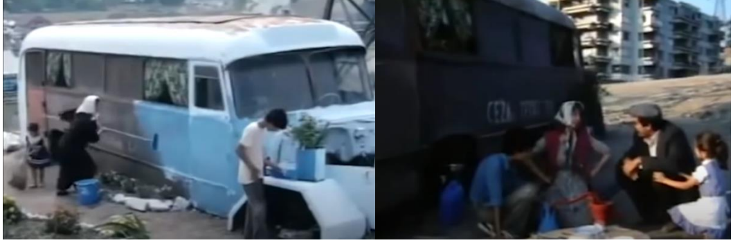
Şekil 4.23: Hurdadan evleri ve arka fonda apartman blokları.

Araba hurdasının arkasında görünen apartman blokları ise kent içerisinde sınıfsal farklılık ve ekonomik koşullar ile şekillenen ayrımı gözler önüne serer (Şekil 4.22). Apartmanlarda yaşayanlar zaman içerisinde göç eden aileden rahatsız olarak şikayette bulunur ve filmin sonunda göç eden aile buldukları yerden devlet zoruyla çıkartılarak hurdaya el konulur. Ancak ekonomik nedenlerle kente göç eden ailenin köye dönme gibi bir durumları yoktur. Hurdadan çıkarılan aile bu seferde başka bir yerde çadır kurarak yaşamlarına devam etmiştir. Barınma hakkını ekonomik nedenler ile elde edemeyen aile kendi buldukları çözümlerle kente tutunmaya çalışmaktadır.