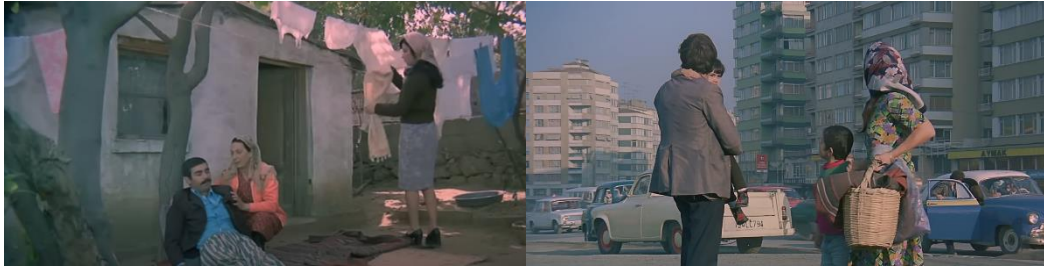
Şekil 4.12: Gecekondu ve apartman bölgeleri.

Gecekondunun önünde yer alan bahçe ise iç mekânın devamı niteliğindedir ve yemek yeme, çamaşır yıkama gibi ev içi faaliyetler burada yapılır. Göç ettikleri yerin kültürel yapısını devam ettirdikleri bu alan aynı zamanda sosyalleşme ve beraber sorunların çözüldüğü bir toplanma mekânıdır (Şekil 4.12).