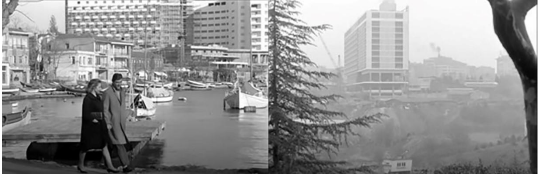
Şekil 4.58: Tarabya Otelı ve Hilton Otelı.

Gurbet Kuşları filminde taşra göstergesi; geleneksele bağlılık, inançlar, töre ve kentli göstergesi olan yeni değerler ile çatışmış olarak resmedilir. Taşralı içi kentte kalabilmenin yolu kentli olmaktır. Ayrıca filmde göç sonrası toplum yapısındaki değişimler ve beğenilerin farklı alanlara kayması; kentin çeşitli bölgelerinin farklı sınıflara ayrılması, kentsel dokunun farklı konut tipolojileri ile çeşitlenmesi ve toplumsal olarak sorunlu bir ortam oluşması olgularıyla aktarılmıştır. Filmde gelir düzeyindeki farklılıklar ve toplumsal ayrışmayla gelen mekânsal ayrışmanın en somut hâli ise konut sunum biçimlerindeki değişimdir.