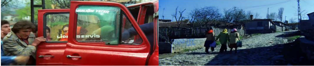
Şekil 4.47: Sultan ve arkadaşlarının işe giderken kullandıkları eğimli yol ve minibüse binme anı.

Mahalledeki kadınların işe giderken kullandıkları düzensiz taşlarla döşenmiş eğimli yolun ve hemen ardından minibüse binerken ki yaşadıkları karmaşa ve düzensizliğin gösterimi, kentte para kazanmalarının zorluğunu ifade etmek için kullanılan araçlar haline gelir (Şekil 4.51).