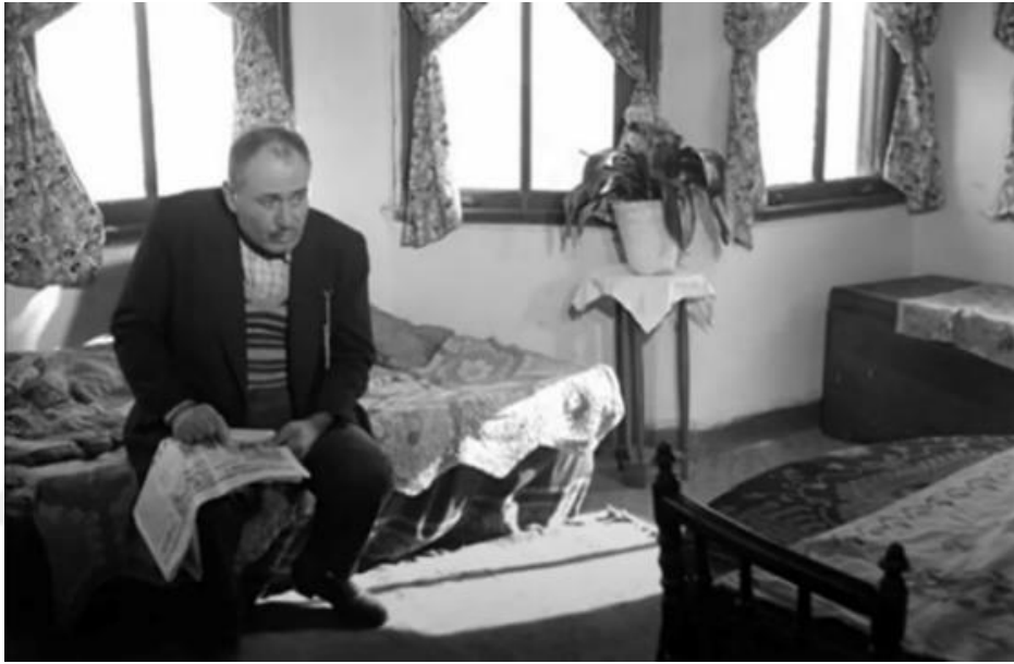
Şekil 4.60: Maraşlı ailenin evi.

İstanbullu olarak resmedilen Ayla'nın ailesinin Cihangir'de bulunan apartman dairesine bakıldığında ise klasik batı üsluplarının hâkim olduğu bir düzen görülür. Ayla'nın babasının Kemal'e 16. Louis döneminden kalma bir gravürü gösterdikten sonra ecdadımızın 200 yıllık şaheseri diyerek bir hat levhası göstermesi ailenin hem batı hem de doğu sanatı ile ilgilendiğini belirtir (Şekil 4.65). Ev içi mekânda ise ahşap oymalı ve kıvrımlı sandalyeler ile koltuklar, oturma birimleriyle uyumlu biçimde klasik üslubun hâkim olduğu ahşap büyük bir masa, sadece dekorasyon objesi olarak mekânda var olan kumaş başlıklı abajur ve salonun bir köşesinde yer alan ahşap büfe toplumdaki statüyü simgeleyen öğeler olarak resmedilir (Şekil 4.66).