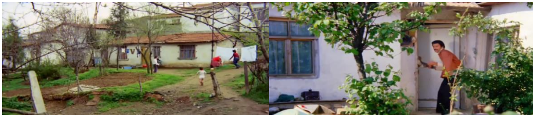
Şekil 4.29: Sultan ve Asiye’nin evleri.

Yaşam tarzları birbirinin aynısı olarak verilen gecekondu halkının yaşadığı evlerde hemen hemen tek bir tipoloji üzerinden aktarılır (Şekil 4.33). Farklı kültürel ve mekânsal özellikler barındıran yerlerden İstanbul’a göç eden bu insanlar, filmde kültür kökenli davranış özelliklerini bir kenara bırakarak kentte homojen bir kültür altında toplanmıştır. Bu durumda karakterlerin yaşadığı gecekondu da aynı plan ve mekân kurgusuna sahiptir (Şekil 4.34). Çatıları kiremitle kaplı gecekondu genellikle tek katlıdır. Bahçelerin bir kısmı derme çatma çitlerle bir kısmı ise briketten yapılmış duvarlar ile çevrilidir. Filmde daha net gösterilen Hatice Abla ve Sultan’ın evleri birbirine benzer nitelikler barındırır. Dış kapı ortak bir alan açılır ve bu ortak alandan evin diğer mekânlarına geçiş sağlanır. Mutfak için ayrı bölüm vardır ve koltuk yerine divanlarda oturulur (Şekil 4.35).