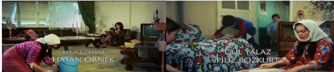
Şekil 4.14: Gecekondu ve apartman iç mekânı.

Gecekondu mahallesinin görüntüsüyle başlayan filmde kırdaki yaşantısını kente taşıyan, kendi yaptıkları gecekondularda yaşayan, sebze bahçeleri ve hayvanları ile kır kültürünü sürdüren yaşam biçimi devam etmektedir. Kent merkezinde ise gecekondularda yaşayan kadınların temizliğe gittiği apartmanlar ve kentli kadının yaşam tarzı gösterilerek dönemin kent-kır yaşantısı arasındaki zıtlık vurgulanmaktadır (Şekil 4.16).