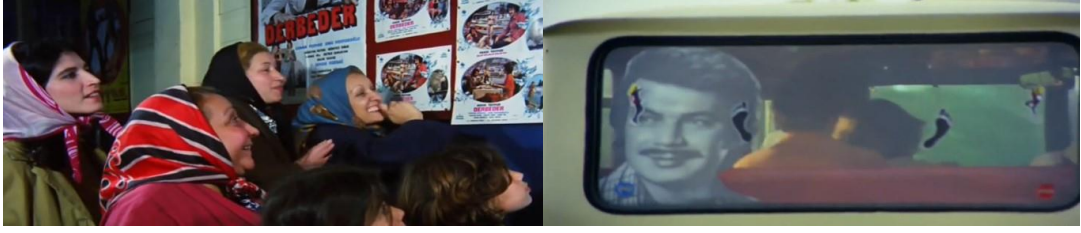
Şekil 4.35: Derbeder filmi ve minibüsteki Orhan Gencebay fotoğrafı.

Güngör'ün [1993], kentleşmeyle gelen kente ve köye özgü değerler ile yaşam tarzlarının karşı karşıya gelmesinden doğan karmaşıklık ve kozmopolit yapılanma olarak tanımladığı arabesk, arada olma hali ve hem köye hem kente dair taşıdığı izlerle mekân ve birey üzerinden sinemasal anlatıya dahil olur. Gecekonducularda yer alan divanlar, süs eşyası olan yapay çiçekler ile çiçek desenli avize, elbiselerde olduğu gibi diğer eşyalarda ve perdelerde görülen yaprak veya çiçek desenleri 18 , kadınların elbisenin altına pantolon giymesi, çeşme başında sıra bekleyen kadınların dolma sarması veya örgü örme arabesk kültürün karmaşıklık ve aradalık halini yansıtır (Şekil 4.40).