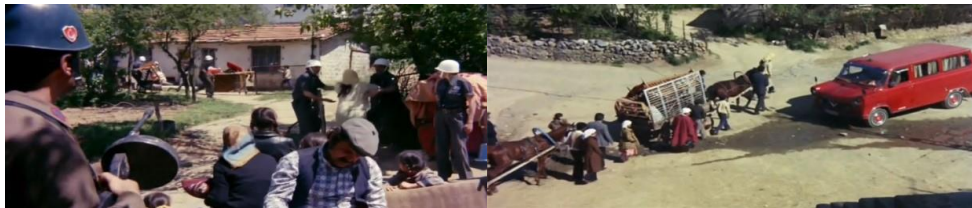
Şekil 4.25: Gecekonduların yıkımı ve gecekonduluların taşınması.

Film sonunda ise gecekondularının yıkılmasıyla göçmenlerin barınma sorununun yeniden ortaya çıkması, kentte hâlâ tutunamamış olmalarını ve kentin içerisinde de hala “göç” halinde olduklarını gösterir. Gecekonduların yıkılmasıyla at arabaları ve birkaç eşya ile toplu olarak kent içinde başka bir yere gitmeleri ve yeniden gecekondular inşa etmeleri, yönetmenin kırdan kente göç sürecini ve göç eden insanların artık köylü de olmadıkları için köye dönüş gibi bir seçeneklerinin olmadığını aktarmasıdır. Kendilerine ait olmayan arazilerde yaptıkları gecekonduları sahiplenen göçmenlerin başka bir yerde yaşama seçeneği yoktur. Apartmanlara maddi olarak gücü yetmeyen ve artık köylerine geri dönemeyen gecekondulular, kent ile bütünleşmeden köy yaşantılarına özgü birtakım değerlerle bu gecekondularda yaşamaktadır. Filmde gecekondular yıkıldıktan sonra başka bir yere göç ederek tekrardan kendi elleriyle gecekondularını inşa etme hali, konut sorununun bu dönem kökten çözümlenmediği için süregelen gecekonduların döngüsüne bir örnektir. Gecekonduların yapımına giriştikleri sahnede “ya bizi buradan da atarlarsa” sorusuna Cevat “buradan artık bizim ölümüz çıkar” şeklinde cevap vermesi ise göçmenlerin ne olursa olsun kenti terk etmek ve memleketlerine geri dönmek gibi bir niyette olmadıklarını ve bir şekilde kentte tutunup yaşamlarına devam edeceklerini gösterir (Şekil 4.29) (Şekil 4.30).