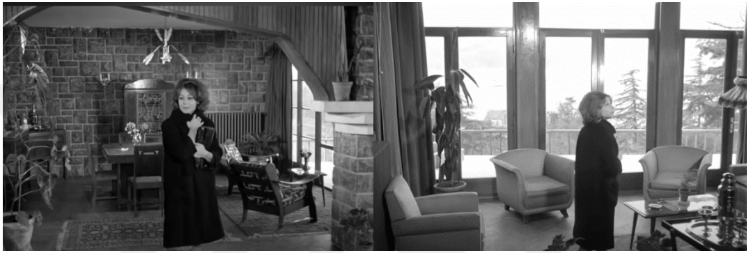
Şekil 4.64: Boğazda bulunan villa.