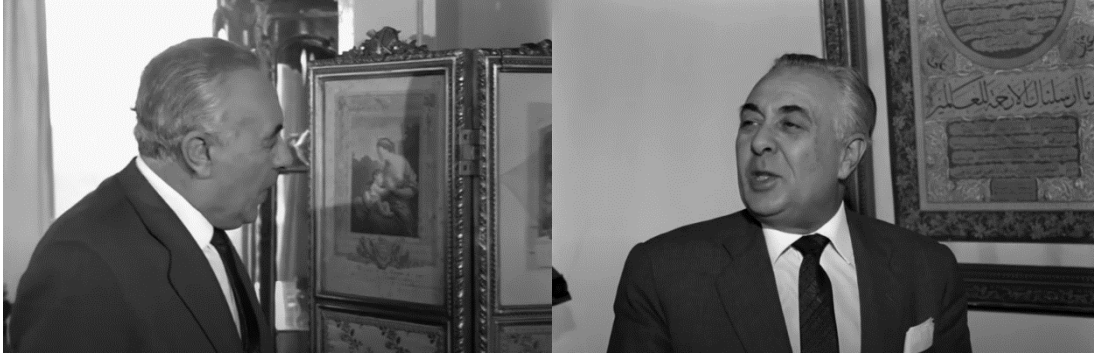
Şekil 4.61: Ayla'nın babasının salonda bulunan koleksiyonu.