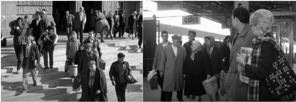
Şekil 4.51: Maraşlı ailenin İstanbul’a gelişi ve İstanbul’a yeni gelen göçmenler.

Maraşlı ailenin gar binasından çıkış sahnesinde elinde bavuluyla, yatak yorganiyla gelen insanlar kadraja girer. Filmin sonunda ise Maraşlı aile memleketine dönerken trenden yeni bir ailenin İstanbul’a şah olmak için göç ettiği sahne verilir. Bu iki sahne ile yönetmen İstanbul’a kitlesel göçlerin başlamasını ve her bir göçmenin kentin ekonomik yönünden faydalanma arzusunda olmasını kendi bakış açısından seyirciye iletir (Şekil 4.55). Bozdoğan’ın [2017] göçmenler için ifade ettiği gibi, filmde de Maraşlı aile bir yandan modernliğin imkanları, estetik normları, yaşam tarzları ve yüksek kültürüyle tanışırken, öte yandan tüm bunların kendilerini yok sayan yönlerinin bilincine varacak ve memleketlerine geri döneceklerdir.