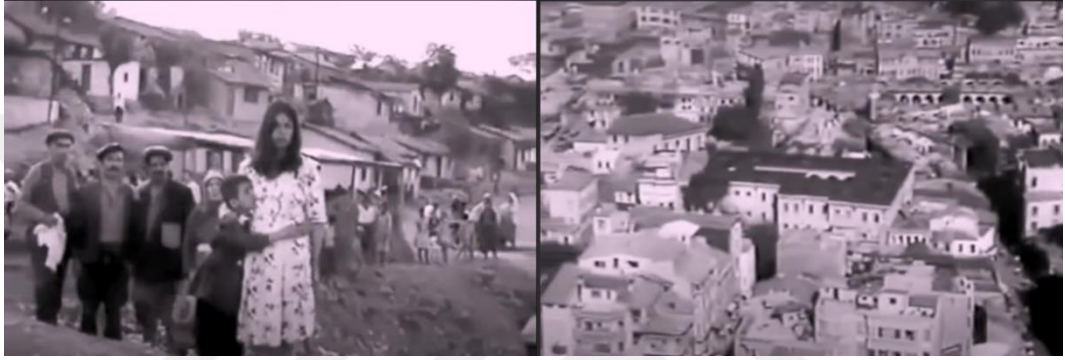
Şekil 4.7: Son sahnede gecekonducuların kent merkezini uzaktan seyretmesi.

Filmin sonunda ise gecekonducuların olduğu tepeden diğer tarafa kamera açısının dönmesiyle kent merkezi görülür (Şekil 4.7). Kentin fiziksel ve kültürel olarak ikili yapısına vurgu yapılırken, son sahnede gecekonducuların birer birer toplanarak kent merkezine doğru bakmasıyla kentten görüntülerin gösterilmesi, ötekileştirilmelerinin ve kentin onları kabul etmediğinin bir yorumu olarak sinemasal anlatıda yerini almıştır.