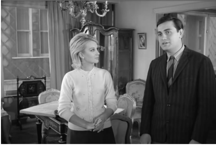
Şekil 4.62: Ayla'nın Cihangir'de bulunan evi.

Film içerisinde Nişantaşı ve Beyoğlu'nda gösterilen apartman daireleri ile Boğazdaki yazlık villada görülen salonda ise Adiloğlu'nun belirttiği gibi “Batı'nın modern çizgilerini taşıyan yapı malzemeleri, mekân düzenlemesi ve örgütlenmesiyle Türk kültürünün mimari dokusunun yok oluş süreci görülür [Adiloğlu, 2005]. Bu mekânlarda modern çizginin hâkim olduğu hareketli mobilyalar, mekânın dışa dönük ve geleneksel konuta göre mahremiyet olgusunun azalmasından kaynaklı büyük pencereler ile jaluziler, 1950'li yıllarda üretilmeye başlanan metal sandalyeler ve Amerikan etkisiyle gelen formika masa ve büfe modernin bir işareti olarak görülür (Şekil 4.67) (Şekil 4.68) (Şekil 4.69).