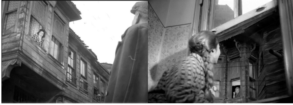
Şekil 4.59: Geleneksel Türk evinde kafes ve çıkma.