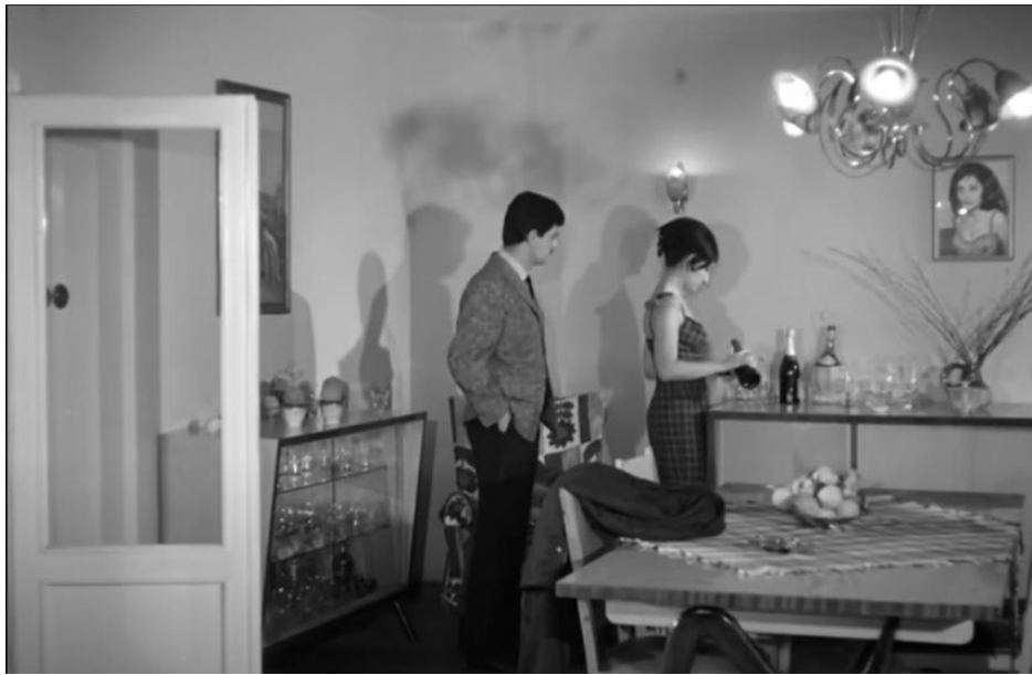
Şekil 4.65: Beyoğlu'ndaki apartman dairesi.

Filmde farklı semtlerde verilen konut tipolojileriyle göç sonrası değişimin fiziksel yansımalarına atıf yapılırken, oturma alanı da hem kültürel yapıyı hem de gelir