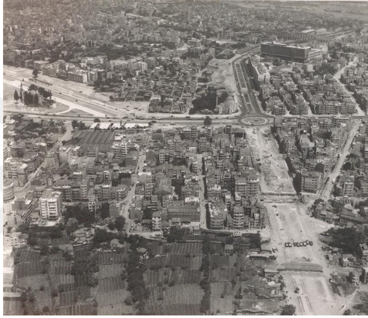
Şekil 3.1: Vatan Caddesi-Millet Caddesi.

Mühendis ve Mimar Odalarının kurulmuş ve bu mesleklere sivil bir inisiyatif kazandırmıştır. 1956 yılında 6875 Sayılı İmar Kanunu'nun çıkarılması dünyada gelişmeye başlayan yeni planlama anlayışının yasadır ve büyüyen kentlerin imar sorunlarına bir yanıt arayışını da yansıtmaktadır. Hızlı kentleşme karşısında planlama, konut ve yapı malzemeleri konularında uzman bir bakanlık olan İmar ve İskân Bakanlığı 1958 yılında kurulmuştur. Böylelikle Türkiye'de ilk defa şehir planlamaya özerk bir nitelik kazandırılmıştır [Özaydın vd., 2010; Tekeli, 1998].