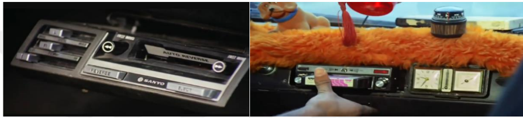
Şekil 4.37: Kasetin takılmasıyla başlayan arabesk müzik.

müzik filmde (sinemadaki Derbeder filmi dışında) sadece dolmuştaki kasetçalara takılan kaset aracılığıyla duyulur, günlük hayatta dolmuştan başka bir yerde arabesk müzik duyulmaz (Şekil 4.42). Kamera kasetin kasetçalara takıldığı sahnelerde yakın çekim girerek, 1970’lerin ortalarında arabeskin yasaklı olmasından dolayı ancak kasetler ile yayılabilmesini aktarır. Tüm bu sahneler ile yönetmen kendi kurgusu özelinde arabeski yorumlamıştır. Filmde yeni kentlilerin arabeski sahiplenme durumu; arabesk müziğin “dolmuş müziği” olarak adlandırılması, dolmuşun arabeski kente taşınması ve arabeskin sinema ve müzik aracılığıyla kitlelere ulaşması şeklinde aktarılmıştır.