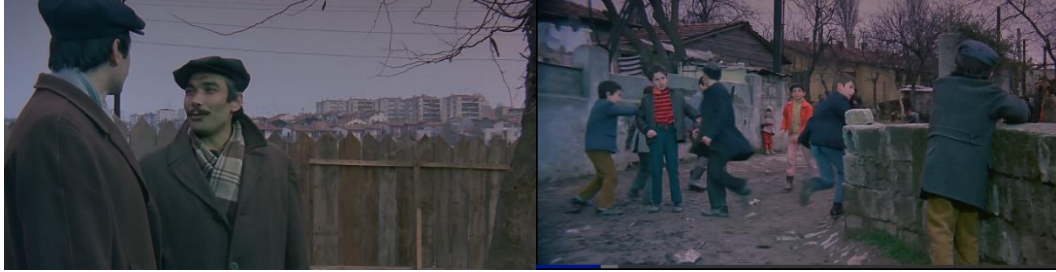
Şekil 4.8: Arka fonda görünen apartman blokları ve gecekondulu mahallesi.

resmedilir. Yaşadıkları gecekondunun arka tarafında ise apartman bloklarıyla kent merkezi kadraja girer. O taraf büyük kentin diğer yanındır ve kente alışmak göç eden aile için kolay olmamıştır (Şekil 4.8).