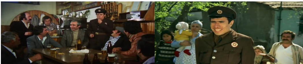
Şekil 4.46: Bekçi Kolombo.

Sonraki sahnelerde Sultan ile komşusu Hikmet kavga ederken veya kahvehanede içki içilirken kadraja giren Bekçi Kolombo, devletin mahalledeki temsilcisi olarak kendi inisiyatifleri doğrultusunda mahalledeki düzeni sağlar. Düzeni sağlayan diğer karakter Muhtar ise devlet tarafından denetlenmeyen arazileri kendi yeriymiş gibi gecekondululara satar. Yönetmen, Bekçi ve Muhtar karakteri üzerinden bu dönem gecekondululara hakim olan düzeni ve kentsel yaşama ilişkin toplumsal eylem pratiklerinin devlet tarafından yaratılmamış olmasının altını çizer (Şekil 4.50).