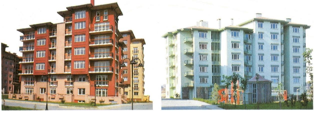
Şekil 3.7: Sinanoba Projesi (sol)-Mimaroba Projesi.

Sonuç olarak, 1980 sonrası döneme bakıldığında önceki dönemlerden ayıran özellik büyük sermaye gruplarının gayrimenkule ve inşaat sektörüne düzenli olarak yatırım yapmaya başlamasıdır [Bilgin, 1998]. 1960-1990 aralığında konuta baktığımızda ise doğrudan kentleşmenin harekete geçirdiği insanların ihtiyacı doğrultusunda üretilmeye başlanmıştır. Bu aralıkta üretilen konutların tamamı kentleşmenin yönünü ve kentlerin biçimlenişini büyük oranda etkilemiştir. 1960-1990 aralığı kentlerin fiziki olarak biçimlenişinin yanı sıra kentlerde yaşayan ve kentlere göç eden toplumun yapısında da önemli değişimlerin yaşandığı bir dönemdir. Konut üretim biçimlerinde görülen farklılıklar, toplum üzerinde de var olduğu ve köylü-kentli kültürü zamanla iç içe geçtiği için modernleşmenin toplumsal açıdan etkileri, kent kimliğini fiziksel ve kültürel olarak biçimlendirme şekli ayrıca incelenecektir.