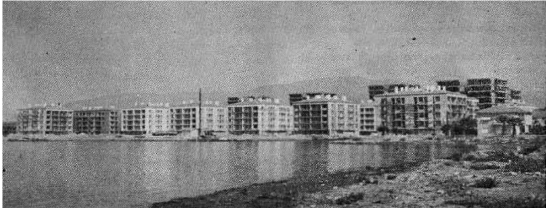
Şekil 3.4: Emlak Bankası İzmir Deniz Bostanlısı Blokları.

tüm ruhsatlı konutlar içindeki payı %11'e ulaşmıştır [Özüekren, 1994]. Kooperatifler, düşük ancak düzenli gelir garantisi olan grupların mülk konut edinmelerini sağlamıştır. Genellikle, büyük bir apartman bloğunun belirli aralıklarla tekrarlandığı bir yerleşme biçimidir [Bilgin, 1996]. Bu dönem Emlak Kredi Bankası da toplu konut üretimine sınırlı bir şekilde devam etmiş ancak maliyetleri ile dar gelirli halk kitlelerine cevap verebilmekten uzak kalmıştır (Şekil 3.4) [Arkitekt, 1978-04]. Emlak Kredi Bankası [Arkitekt, 1978-04] ise “henüz toplu konut inşasında sürat sağlayan prefabrik elemanlarla çalışmaya başlayamamış olduğundan vakit kaybedildiğini ve bunun da maliyetlerin artmasına neden olduğunu” belirtmektedir. Özellikle sendikaların önyak olduğu konut kooperatifleri dikkat çekmektedir (Maden-İş Merter Sitesi gibi). Ayrıca Ordu Yardımlaşma Kurumunun (OYAK) üyelerine yapıp sattığı konutlarda toplu konut yapımının önemli bir kesimini oluşturmaktadır. OYAK Sitesi, I. Ordu Kooperatif Evleri, Harp Akademileri Subay Yapı Kooperatifi büyük ölçekli uygulamalardır [Sey, 1994].