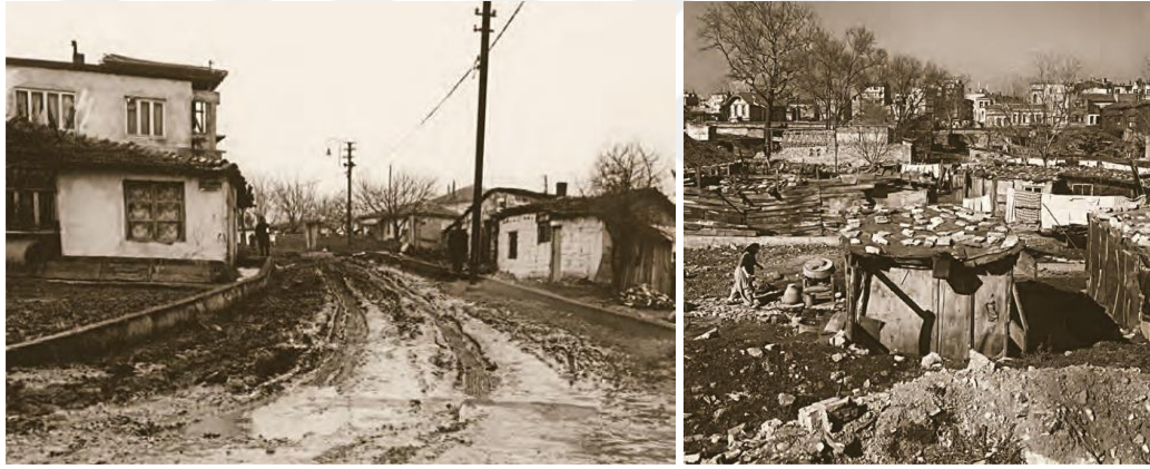
Şekil 3.5: Bir zamanlar âdeta İstanbul'la özdeşleşen gecekondular ve gecekondu mahallesinin sokakları (t.y.).

Başlangıçta “engellenebilir bir yer değiştirme eylemi” olarak görülen gecekondulaşma, sonraki yıllarda toplumsal sonuçları giderek büyüyen ve büyük şehirlerde daha derin hissedilen bir olaya dönüşmüştür [Tekeli ve Gülöksüz, 1983]. 1950'lerin teneke damlı, altyapısız gecekondu mahalleleri, 1970'lerin sonunda ise getirilen resmi olanaklar ve kurallar sonucu kentlerin düzgün, düşük yoğunluklu, yeşil ağırlıklı, altyapılı mahallelerine dönüşme yoluna” girmiştir [Şenyapılı, 1998].