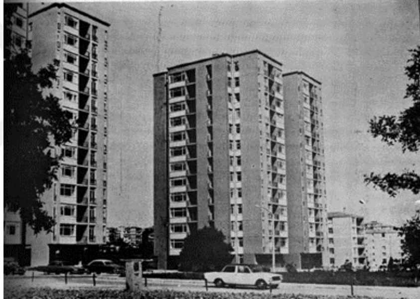
Şekil 3.3: Emlak Bankası İstanbul-Ataköy Sosyal Konutları.

Yap-sat apartman bölgeleri, herhangi bir tasarım disiplininin yoksun, müteahhitlerin uygulama sürecinde geliştirdikleri orta sınıf yaşama formatı tarafından belirlenmiştir. Apartmanların tamamı, betonarme iskelet ve geleneksel tuğla duvar örgüsüyle yapılmış, ince inşaat donatısı ise yapı malzemesi piyasasının sunduğu imkânlar doğrultusunda belirlenmiştir [Bilgin, 1996].